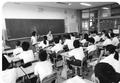
高森中学校福祉学習