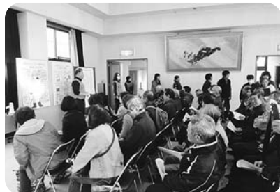
災害ボランティアセンター 立ち上げ訓練